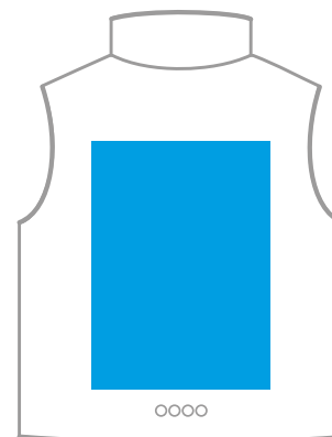
Грудь слева справа